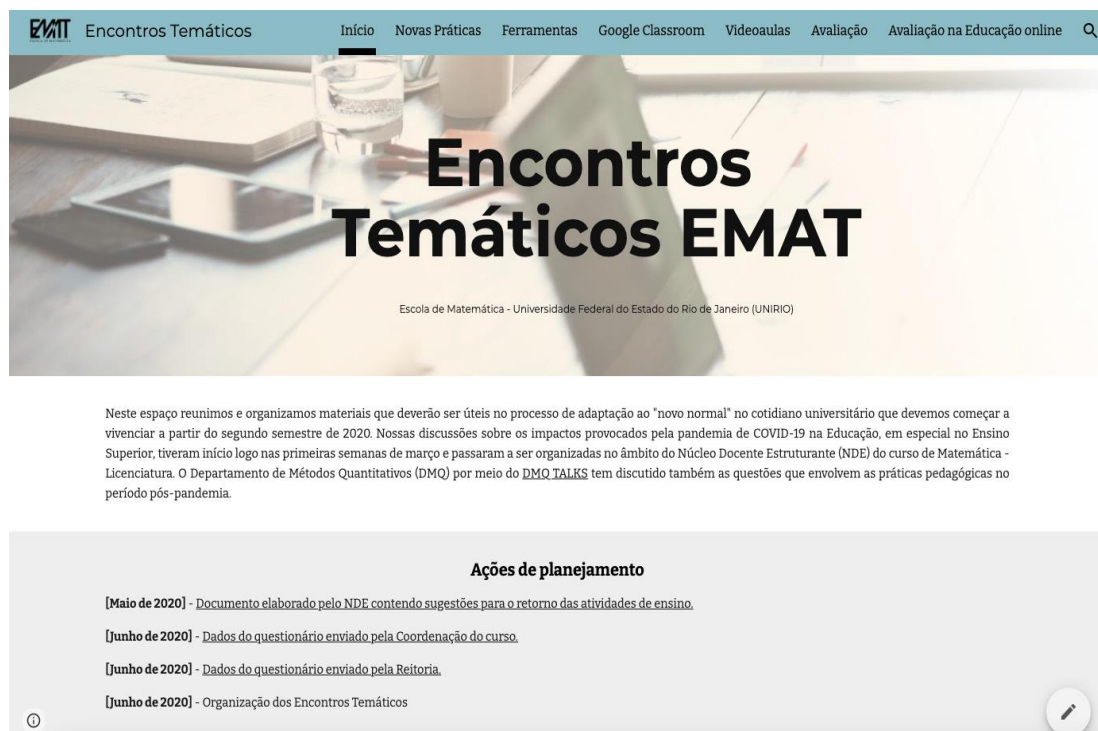
Figura 1: Site dos encontros temáticos

A organização dos ET teve início com um questionário que foi enviado para todos os docentes da Escola de Matemática. Além de indagar sobre o interesse em participar das reuniões, para compartilhar experiências e aprender, juntos, sobre as possibilidades de ensino no “novo normal”, o questionário solicitou que o docente escolhesse, entre os temas a seguir, aqueles que mais teria interesse em discutir: uso do Google Sala de Aula ; videoaulas; novas práticas didático-pedagógicas; avaliação; e atividades síncronas versus assíncronas. Dentre os 32 docentes dos departamentos de Matemática (22) e de Métodos Quantitativos (10), 22 responderam ao questionário, todos manifestando interesse em participar dos encontros. Sobre a preferência dos temas a serem tratados, o resultado foi: uso do Google Sala de Aula (68,2%); videoaulas (59%); novas práticas didático-pedagógicas (77,3%); avaliação (72,7%) e atividades síncronas versus assíncronas (72,7%). A partir daí, a coordenação do curso organizou três ET – todos realizados por meio da plataforma de webconferência Google Meet – e desenvolveu um site de apoio 4 reunindo informações, materiais, links para repositórios, referências, além das gravações dos encontros.