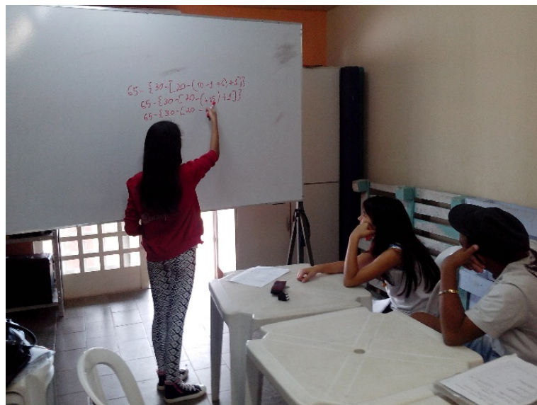
Figura 1 – Situação de Avaliação formal