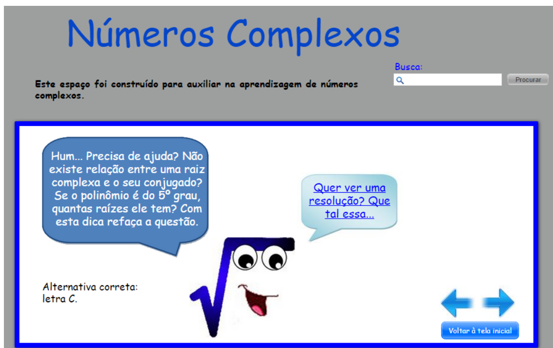
Figura 2 – Apresenta-se uma informação ao estudante, ajudando-o na resolução de uma questão

Ao resolver a questão, o estudante pode avançar e ver a resposta correta. Caso o estudante erre, um personagem, chamado Radice 4 entra em ação. Este personagem é como um agente nos aplicativos, que conversa com os estudantes, questionando-os, desafiando-os e dando algumas dicas e informações para prosseguirem nas atividades, desempenhando um papel fundamental, ao ser parceiro do professor.