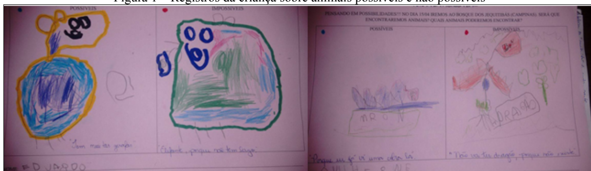
Figura 1 – Registros da criança sobre animais possíveis e não possíveis

Para ouvi-los, foi organizada uma roda e a professora atuou como escriba anotando num cartaz, com caneta azul os animais que as crianças acreditavam que era possível encontrar e com caneta vermelha os animais que as crianças achavam impossível encontrar. Essa atividade favoreceu a reflexão sobre a escrita com as crianças. Após esse momento, foi proposta outra discussão sobre as questões, retomando os nomes dos animais escritos no cartaz. Na sequência, as crianças foram orientadas a desenhar e a justificar individualmente o que pensaram, as justificativas foram anotadas pela professora e, posteriormente, foram retomadas coletivamente.