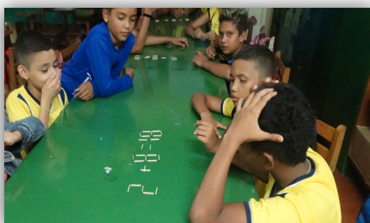
Figura 3 – Os alunos demonstrando a solução de dois problemas.

Durante a apresentação dos enigmas, os próprios alunos foram se agrupando para resolver os exercícios e envolveram, também, as formas geométricas e os algarismos romanos, discutindo as possibilidades de solução. Sempre que acreditavam ter conseguido solucionar um problema, explicavam o raciocínio utilizado no quadro para os colegas, se estavam certos, “ Ótimo! Parabéns! ”, se não, “ Pensa mais um pouquinho. ” e quando não conseguiam, pediam auxílio e novamente buscavam a solução.