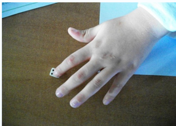
Figura 3: Contagem dos pontos obtidos nos dados.

No início, observamos que algumas crianças não haviam compreendido muito bem a regra que diz que “Quando a soma dos dados der sete, na primeira vez, coloca-se o coquinho no número sete”. Se a soma der sete novamente, o jogador coloca no tabuleiro uma cobra, a que chamamos de “colocar uma cobra no ninho”. Observamos que as crianças que já tinham obtido o resultado sete marcado pelo coquinho, quando obtinham a soma sete novamente tiravam o coquinho e colocavam a cobra, ao invés de deixar o coquinho e acrescentar a cobra na cartela. Esse momento é apresentado por Grandó (2004) como um momento de se jogar “para garantir as regras” (p. 54) já que os alunos estão se apropriando delas, para posteriormente ter-se a certeza de que as regras foram compreendidas e serão cumpridas.