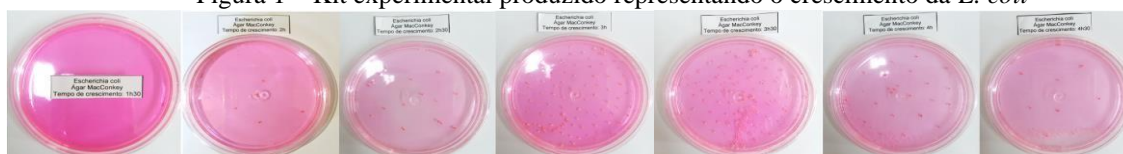
Figura 1 – Kit experimental produzido representando o crescimento da E. coli

Os 7 tubos de ensaio de plástico substituem os tubos laboratoriais de vidro e simbolizam bactérias nos meios de cultura líquidos Caldo Lauril ou Caldo Nutriente 7 (representado pela mistura de água, tinta guache e corante) nos diferentes instantes de tempo. A diferença de turbidez entre os líquidos dos tubos exprime o crescimento bacteriano, porém optamos por não os aplicar diretamente na atividade, devido a impossibilidade de quantificar o índice de turbidez a olho nu.