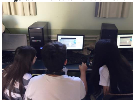
Figura 5 – Alunos utilizando o Tracker