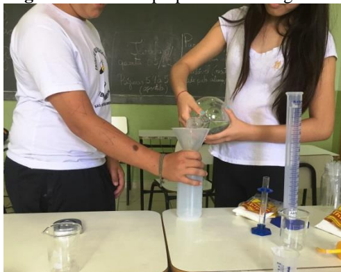
Figura 7 – Alunos preparando os reagentes

Para tanto, os alunos replicaram os procedimentos evidenciados em sua pesquisa, dispondo de vidrarias e reagentes encontrados no laboratório da escola, conforme indicado na Figura 7. Ao todo, foram confeccionadas sete amostras diferentes de slime , com diferentes proporções de reagentes, conforme apresentado na Figura 8.