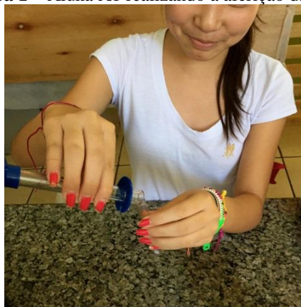
Figura 1 – Aluna A1 realizando a aferição da água

O mesmo ocorreu com a aferição da temperatura da água, para a qual foi feito o uso de termômetro de mercúrio, conforme indicado na Figura 2. Por mais que a aluna nunca havia manuseado antes um termômetro analógico, tratava-se de um procedimento conhecido e, instintivamente, a aluna realizou as leituras corretas de temperatura.