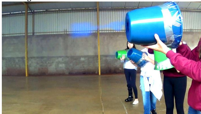
Figura 4 – Alunos manuseando o canhão de vórtex

Com isso, a unidade “Evidenciação da trajetória do ar” se deu com a utilização de um bastão que emitia fumaça colorida, tornando evidentes os “anéis de fumaça” que eram liberados do canhão. A utilização de tal recurso se mostrou ser algo inédito, não apenas para a aluna A1, mas para todos os alunos da turma. A Figura 4 apresenta um canhão de vórtex sendo manuseado.