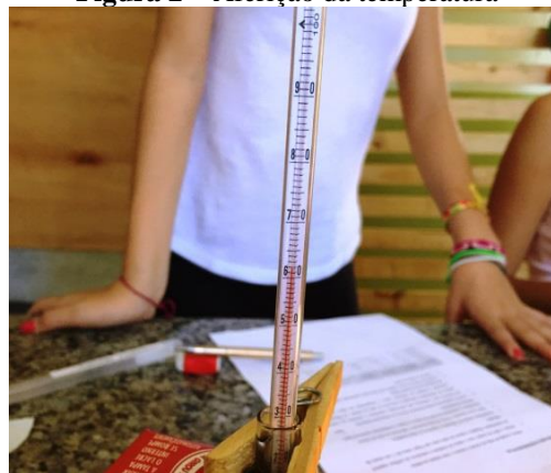
Figura 2 – Aferição da temperatura