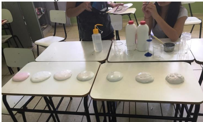
Figura 8 – Slimes confeccionados