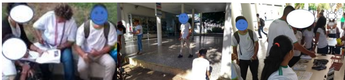
Figura 1: Aluno na sua turma original, nova turma e na Semana Tecnológica.

agregam nos processos de ensino e de aprendizagem. Isto pode ser constatado em algumas ações como: assistir todas as aulas da turma iniciante; ao realizar uma tarefa na turma original ele sempre levava a mochila conforme ilustrado na primeira imagem da Figura 1; com a turma iniciante ele passou a deixar a mochila na sala de aula para realizar as tarefas juntos com os colegas, mostrando pertencimento àquele grupo, conforme ilustrado na segunda imagem da Figura 1. Nota-se um sentimento de pertencimento à escola quando o aluno participa e interage com os colegas na Semana Tecnológica da instituição visitando somente os stands da nova turma, como apresentado na terceira imagem da Figura 1. Isto foi observado tanto para os pesquisadores quanto para o acompanhamento pedagógico, que resolveu transferir o aluno para a turma iniciante do mesmo curso.