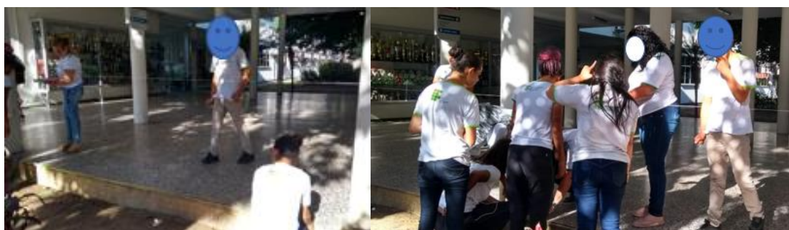
Figura 2: Tarefa de medida do perímetro e área de um terreno.

aula. No início da atividade, o aluno com deficiência intelectual só observou os colegas conforme primeira imagem da Figura 2. Aos poucos ele se aproximou e passou a interagir, conversando com os colegas como podemos observar na segunda imagem Figura 2.