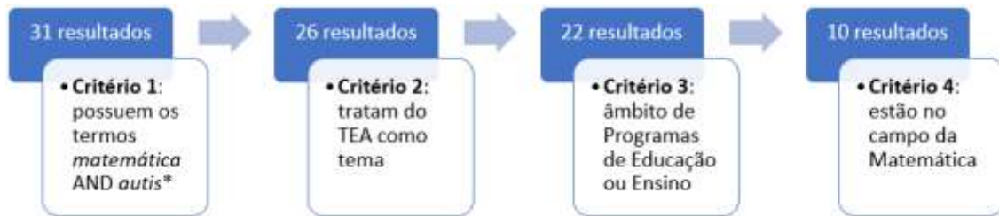
Figura 1: Percurso de seleção de documentos para comporem o corpus empírico

ou trabalhados junto aos alunos autistas, estabelecer sua possível relação com as habilidades da BNCC e responder a questão de pesquisa proposta.