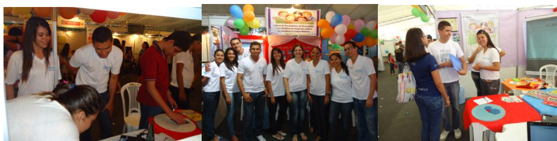
Exposição na XVIII CIENTEC