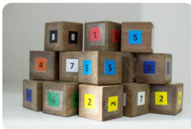
Figura 2 - Material para exposição