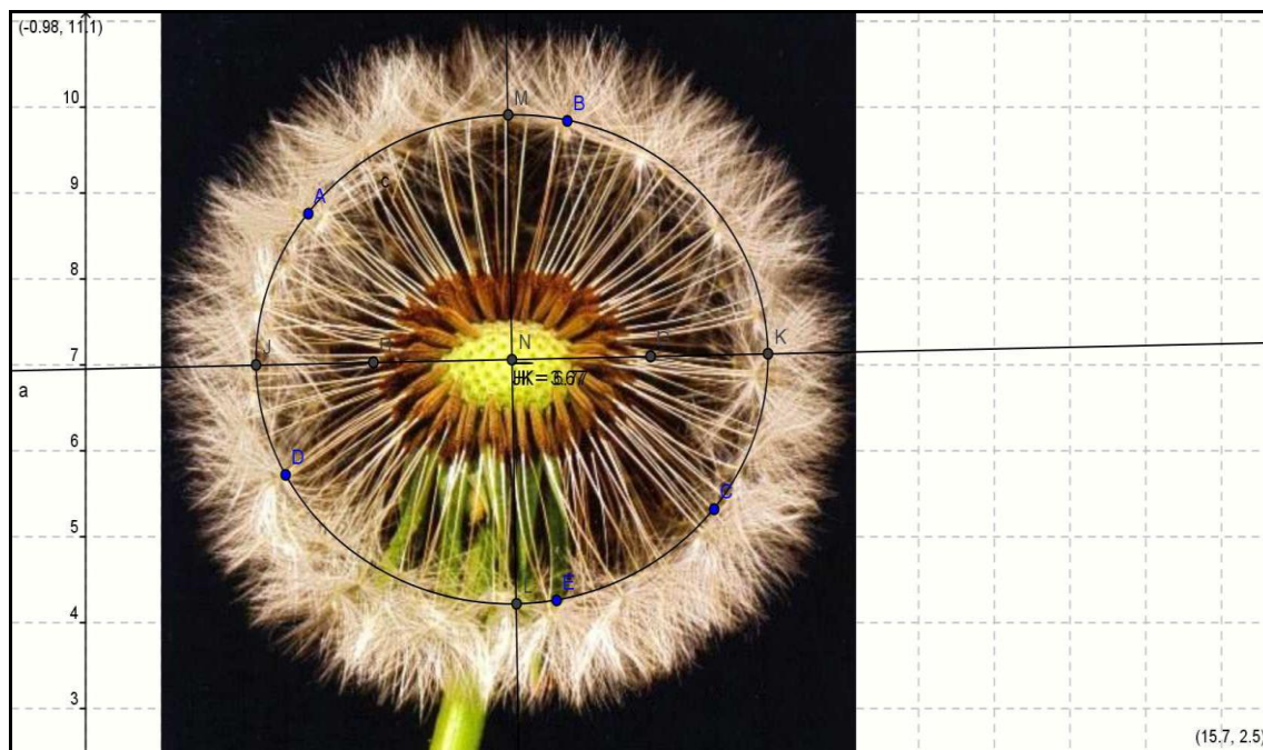
Figura3 : Analisada por um dos grupos

Nessa atividade os estudantes trouxeram arquivos com fotos de curvas na expectativa de identificar uma Elipse. Um dos grupos analisou a foto de uma flor conhecida por “dente de leão”, chegando a algumas conclusões.