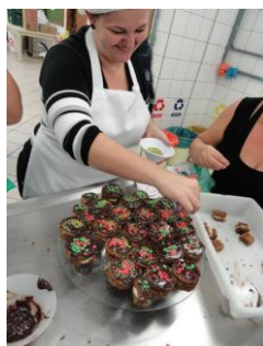
Ilustração 2: Produção de doces na aula de gastronomia

Na abordagem dos conteúdos de pesos, medidas e proporção, as alunas tiveram uma aula de Gastronomia na Universidade Regional de Blumenau onde aprenderam, na prática, os conceitos matemáticos, ao elaborarem e prepararem receitas culinárias (Ilustração 2). Ao seguirem a receita, trabalharam a pesagem e conversão de medidas dos ingredientes. Depois, discutiram como modificar as quantidades dos ingredientes de forma proporcional. Esta atividade contribuiu para que uma das alunas aprimorasse e formalizasse o seu empreendimento culinário, o qual envolve a produção e comercialização de doces e salgados sob encomenda. Desta forma, a atividade contribuiu para o ODM “Igualdade entre sexos e valorização da mulher”, ao incentivar a participação das mulheres no mercado formal de trabalho.