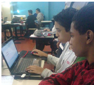
O uso do computador – (pesquisa)

4: Com os slides confeccionados, os cartazes construídos, as maquetes projetadas (alguns grupos usaram de mais criatividade), o experimento de Tales sistematizado e as relações conceituais estabelecidas, os grupos iniciaram as apresentações dos seminários.