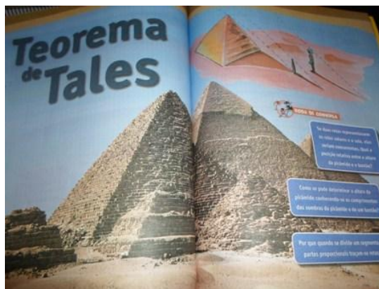
Imagem do material didático da Rede

Em grupos, começaram as discussões. Ao participar das discussões junto aos grupos, observamos que os alunos notaram que precisavam de conceitos matemáticos para respondê-las.