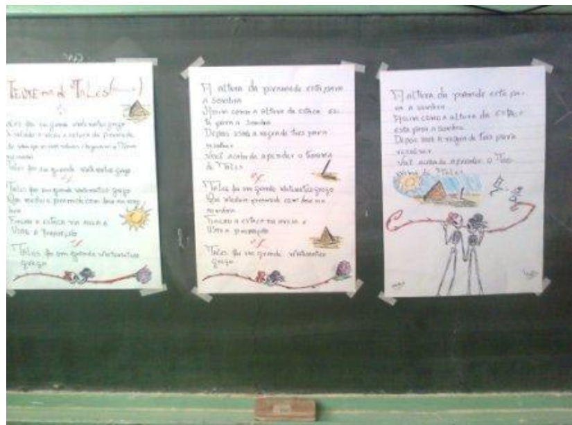
Cartazes – materiais para exposição dos grupos