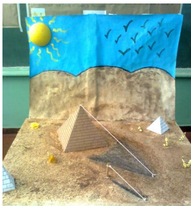
Maquete produzida pelos alunos (Incidência, paralelismo, perpendicularismo)

Trabalho educativo é o ato de produzir, direta e intencionalmente, em cada indivíduo singular, a humanidade que é produzida histórica e coletivamente pelo conjunto de homens. Saviani (2000)