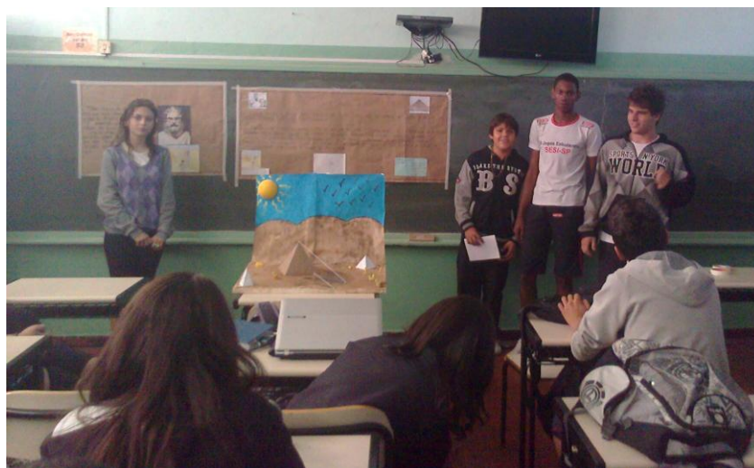
Socialização dos grupos e discussões coletivas dos conceitos em estudo