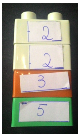
Figura 7 – Resultado do MMC entre 20 e 15..