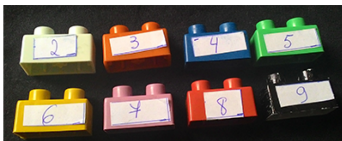
Figura 1 – Peças numeradas do 2 ao 9.

Foram utilizadas peças de lego, de preferência, todas do mesmo tamanho e de 8 cores distintas, enumerando-as do número 2 ao 9, conforme podemos observar na imagem abaixo: