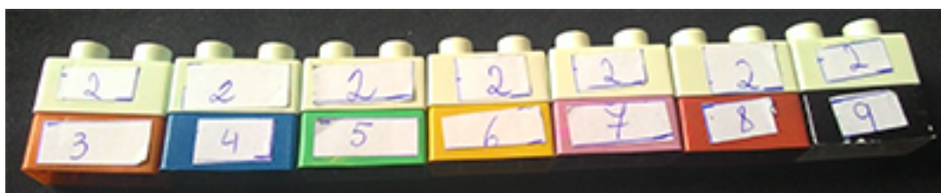
Figura 4 – Tabela de multiplicações do número 2.

A extinta “tabuada” que hoje é explicada pelos professores de matemática como a tabela de multiplicações pode ser formada com as peças de lego também. Na foto abaixo, observamos os múltiplos de 2.