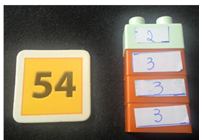
Figura 5 – Decomposição do número 54.

Dentre as nossas peças que vão do número 2 ao 9, os números 2, 3, 5 e 7 são os números primos, que podem construir, a partir da multiplicação, todos os outros números naturais. Todo e qualquer número natural pode ser decomposto em números primos, como nos afirma o Teorema Fundamental da Aritmética. Com essas 4 peças podemos formar diversos números. Note na imagem abaixo a decomposição do número 54.