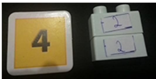
Figura 8 – Número 4 como forma de potenciação.

Na figura abaixo notamos o número 4 sendo representado em forma de potência através das peças de LEGO.