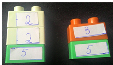
Figura 6 – MDC entre os números 20 e 15.

Como falamos, ao juntarmos 2 ou mais peças de lego é feita a multiplicação entre os números que cada uma representa. Para realizar o MDC, utilizamos apenas as peças com os números 2,3,5 e 7 que são os números primos.