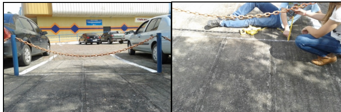
Figura 1: alunos bolsistas coletando dados.

O aluno A1 respondeu que era possível marcar no chão pontos de 20 cm em 20 cm e marcar um eixo, correspondente ao eixo x , e, em cada ponto desse eixo, marcar-se-ia a altura da corrente em cada um deles, o que corresponderia ao eixo y . Os outros alunos aceitaram a sugestão e, com o material que já tinham, no caso, giz e fita métrica, iniciaram seus registros (quadro 1), conforme ilustrado na Figura 1.